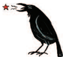
Krasse Kraai (adem/stem)