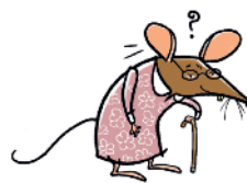
Oma muis (gehoor)