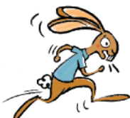
Haasje Repje (stotteren)