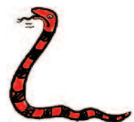
Slissie Slang (mondgewoonten)