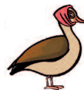
Nadja Nijlgans (Nederlands als tweede taal)