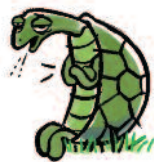
Slomie Schildpad (articulatie)