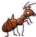
Mischa Mier (auditieve vaardigheden)